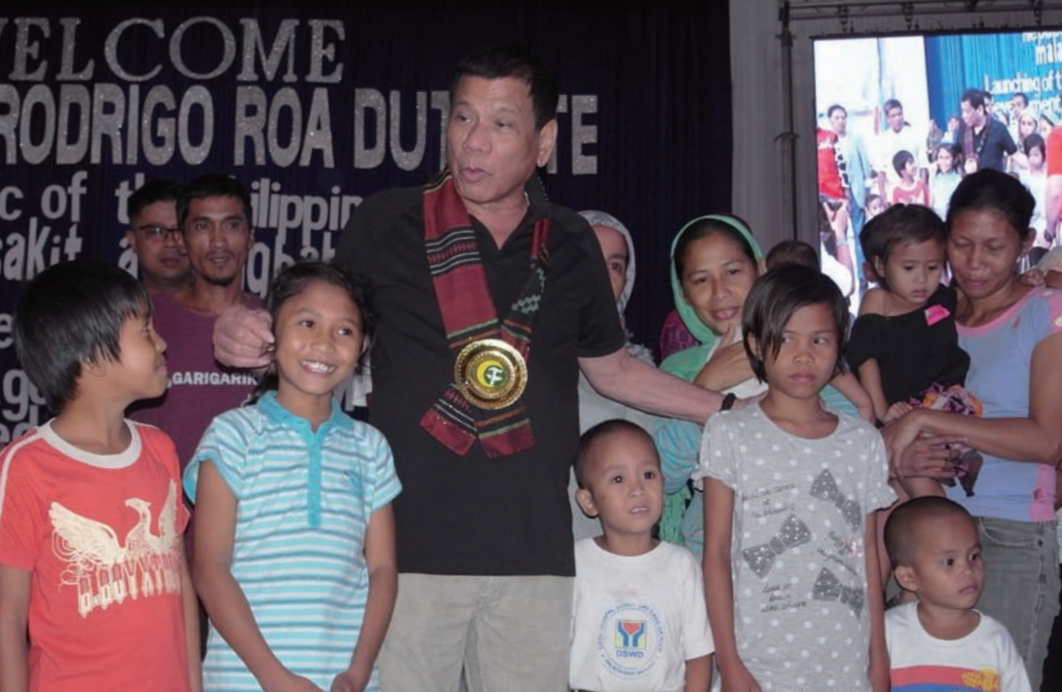
地域開発プログラムの式典で貧困家庭の子どもたちと触れ合うドゥテルテ大統領 =コタバトのARMM政府・文化ホールで10月29日撮影