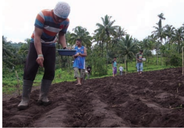
高台の農地に陸稲の種をまく農民たち＝カバタガン町タブアン集落

ところで、アブバカルにはタリブと同様、CD-CAAM視察などで知り合ったMILFメンバーが何人かいて、彼らの経歴や暮らしぶりは当連載でも紹介した。数カ月ぶりに来たついでに、マタノグ町サパド集落の農民組合会長で、元MILF大隊