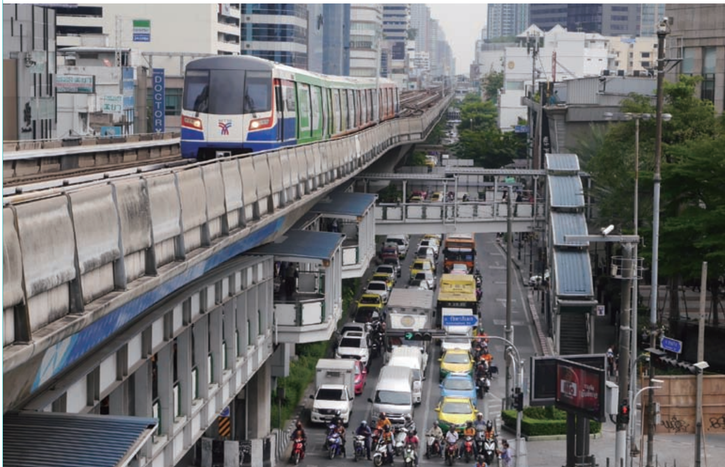
バンコク市内を走るBTS(高架鉄道)